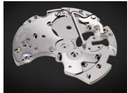
neu entwickelte Dreiviertelplatine für Chronographen