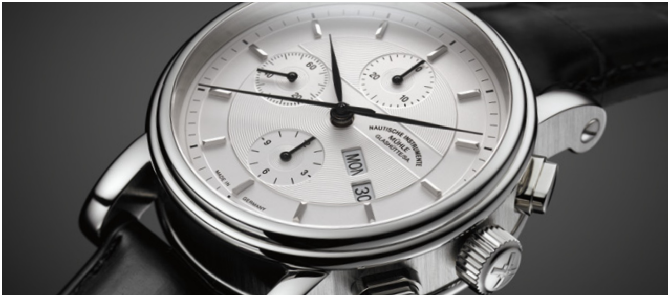
Teutonia II Chronograph